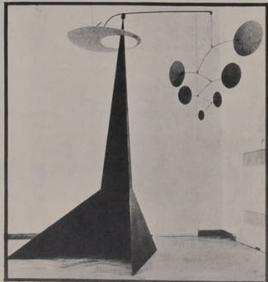
Due opere di Alexander Calder esposte all'Arco d'Alibert di Roma. Qui sopra, un "mobile-stabile" o "totem" che Calder ha intitolato "Pekin". In alto, "Ritratto di Giovanni Carandente", fil di ferro del '67