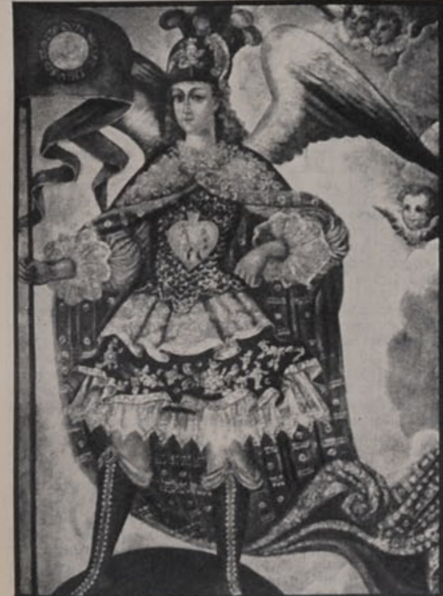
"ARCANGELO MICHELE", SCUOLA PERUVIANA DEL XVIII SECOLO.