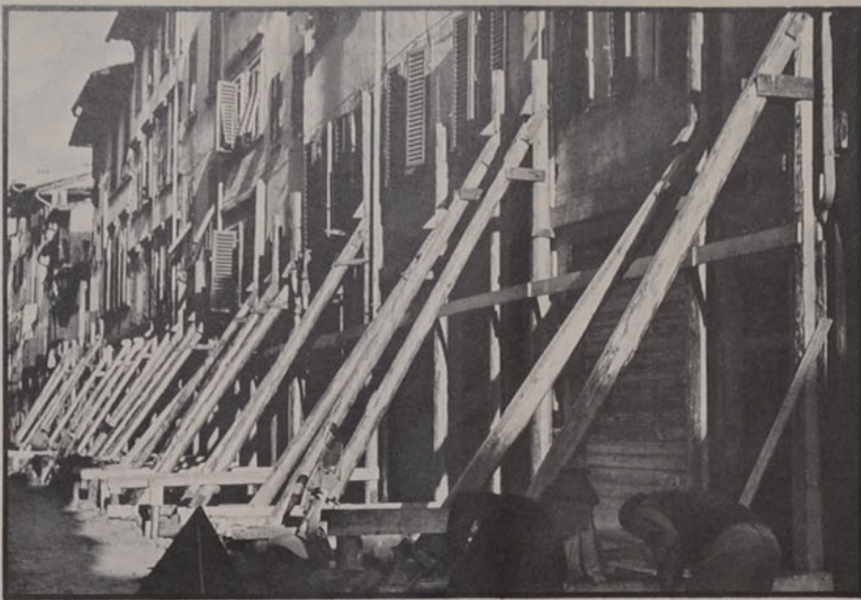
Firenze. Le case inabitabili e pericolanti di via dei Macci, nel rione Santa Croce. Nella foto in basso: Firenze. Piazza Ghiberti, dove dovrebbe sorgere una Moderna scuola e una casa-albergo per anziani.

La data per la prossima Biennale Internazionale dell'Antiquariato di Firenze è stata fissata dal 22 settembre al 22 ottobre del '67. Vi parteciperanno 14 paesi stranieri.