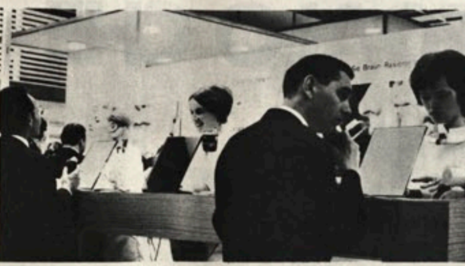
Barbe italiane e francesi, tedesche e arabe, ungheresi e giapponesi: Braun sixtant non conosce frontiera, rade morbido, rade rapido, rade accurato. Qui siamo a Hannover in Germania. Si prova Braun sixtant e la prova, come sempre, convince!