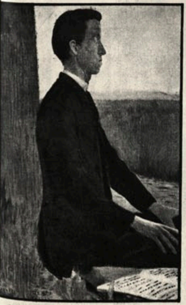
Maurice Denis: Ritratto di Raphael Lemeunier.